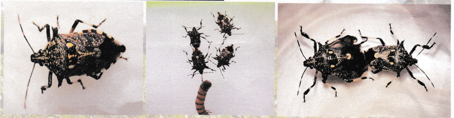
ຮູບພາບ: ໂຕແກ່ເຕັມໄວຂອງແມງແຄງພິຄາດ, ລັກສະນະການກິນໜອນນົກ ແລະ ການປະສົມພັນກ່ອນວາງໄຂ່