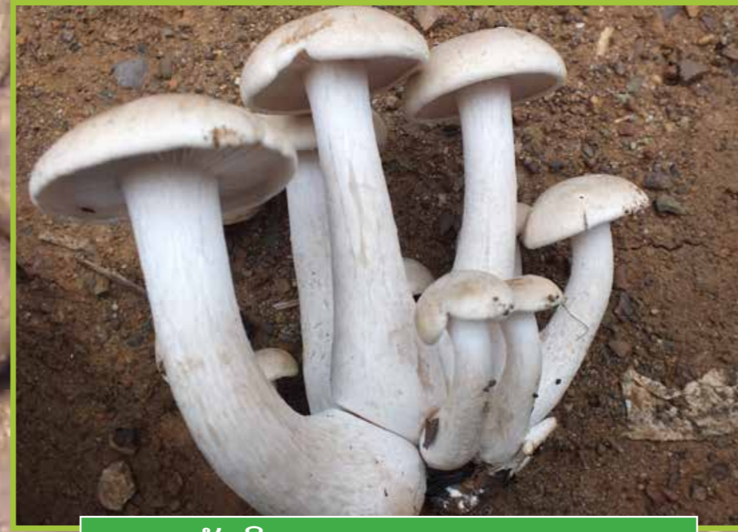
ເຫັດຕິນແຮດ ( Macrocybe crassa )