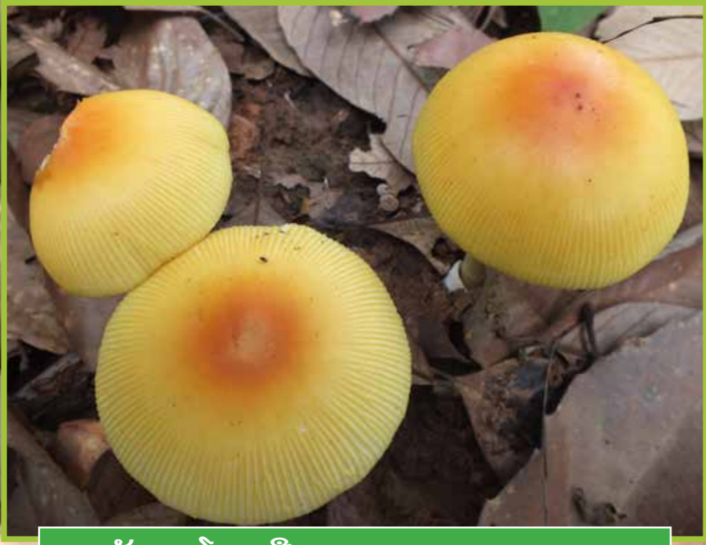
ເຫັດລະໂງກເຫຼືອງ ( Amanita hemibapha )