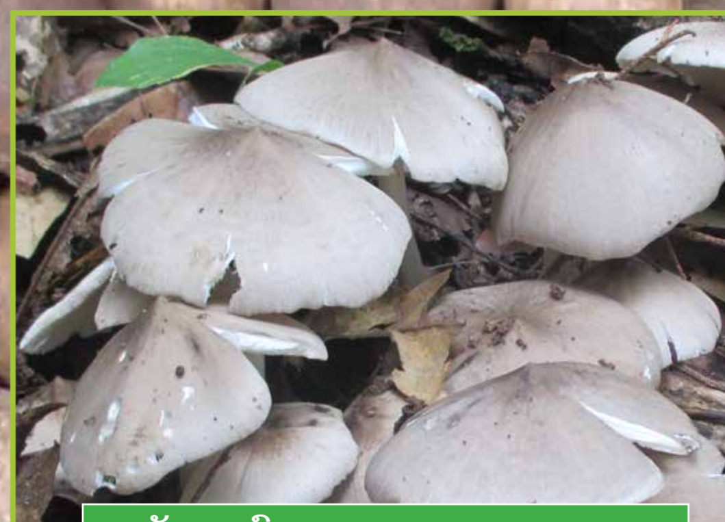
ເຫັດຕາບດົງ ( Termitomyces cf. clypeatus )