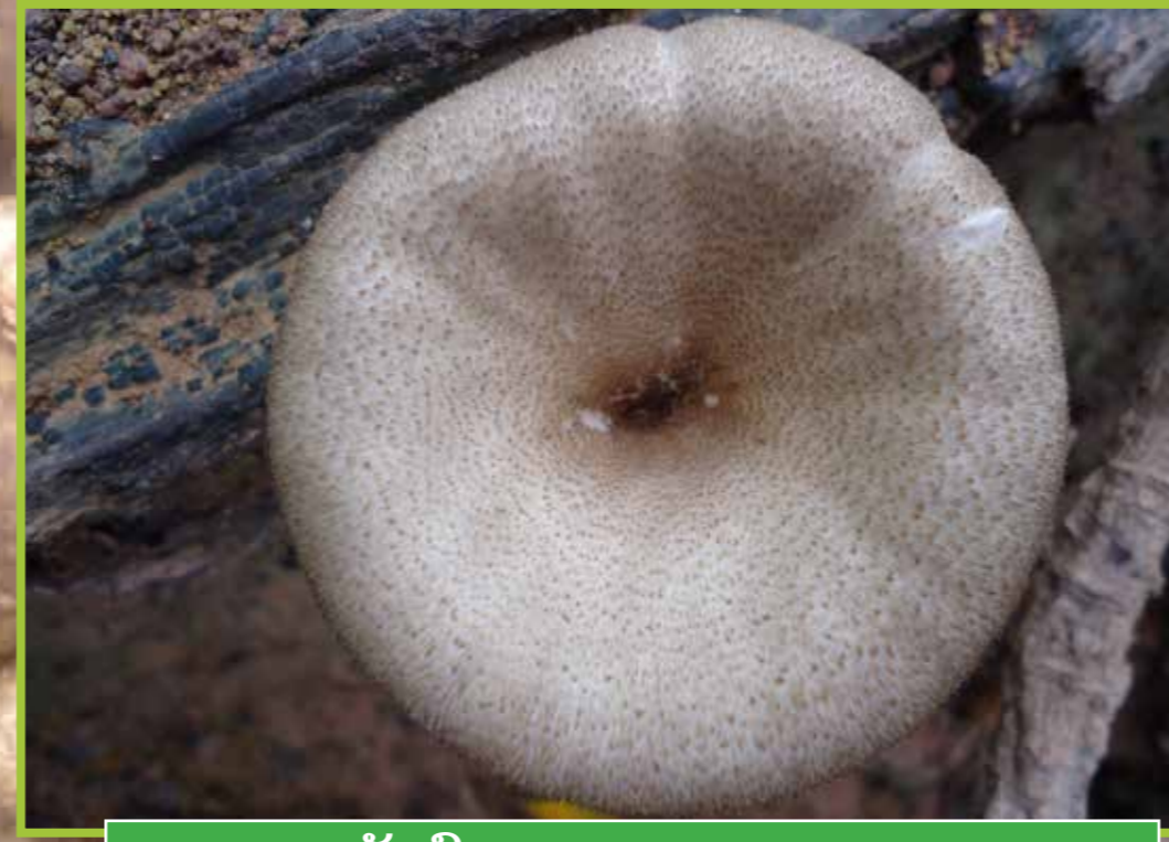
ເຫັດບົດ ( Lentinus polychrous )