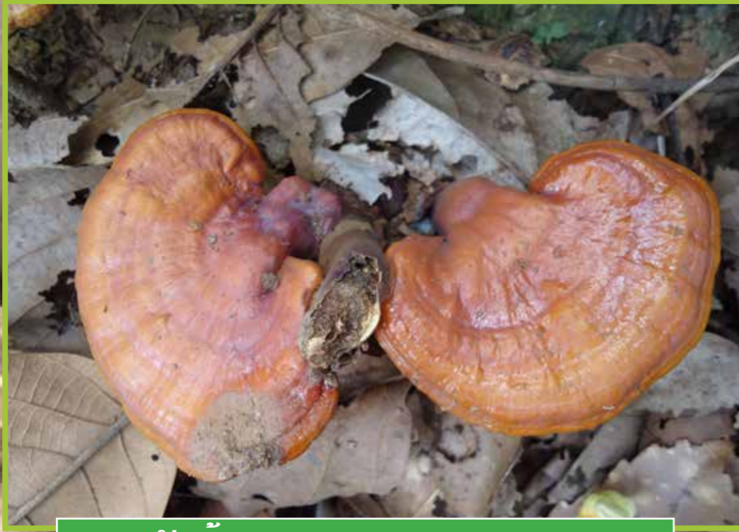
ເຫັດກ້ານຈອງ ( Ganoderma lucidum )