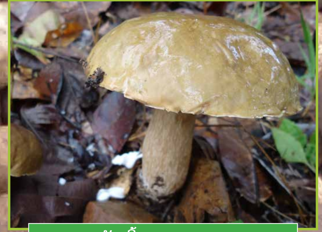
ເຫັດເຜິ້ງ ( Boletus edulis )