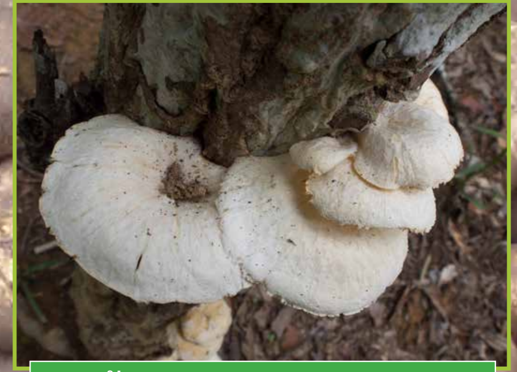
ເຫັດຂອນຂາວ ( Lentinus squarrosulus )