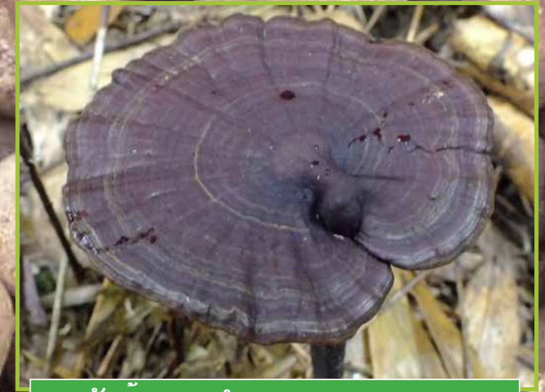
ເຫັດກ້ານຈອງດຳ ( Amauroderma rugosum )