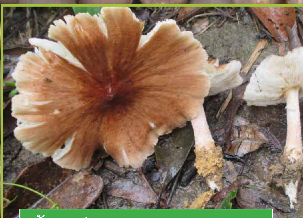
ເຫັດຕາບຟານ ( Termitomyces cf. aurantiacus )