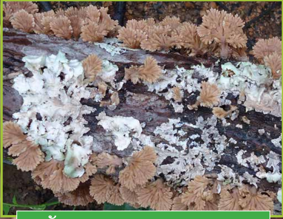
ເຫັດສະມອດ ( Schizophyllum commune )

ທຳມະຊາດທີ່ກິນໄດ້ ແລະ ເປັນຢາຢູ່ພາກເໜືອຂອງ ສປປ ລາວ Wild edible and medicinal mushrooms in northern Lao PDR