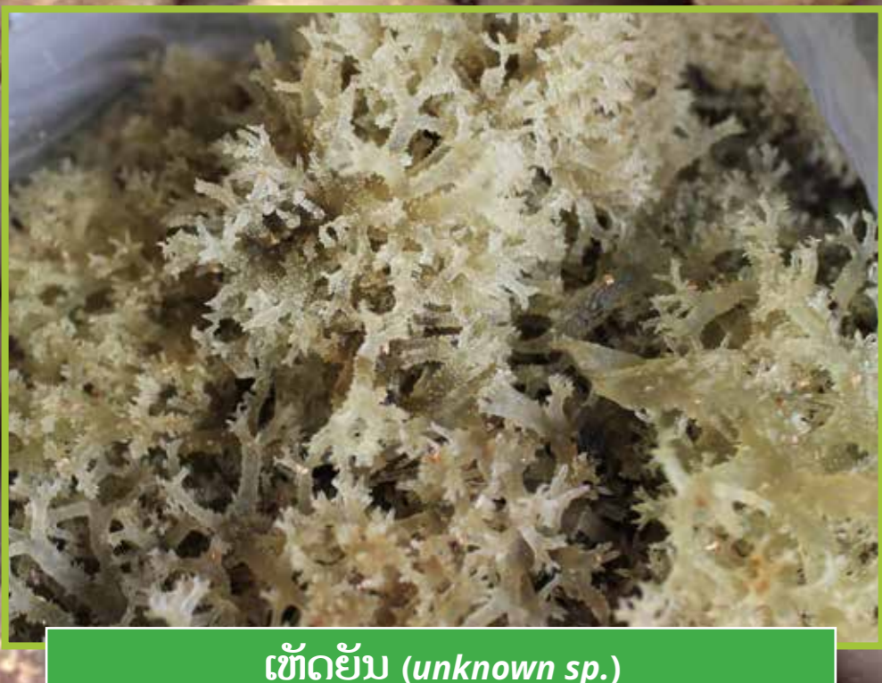
ເຫັດຍັນ ( unknown sp. )