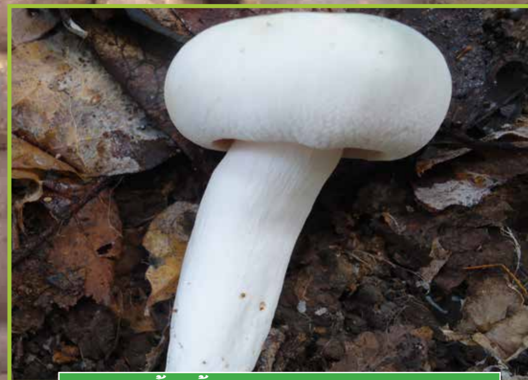
ເຫັດນ້ຳແປ້ງ ( Russula cf. alboareolata )