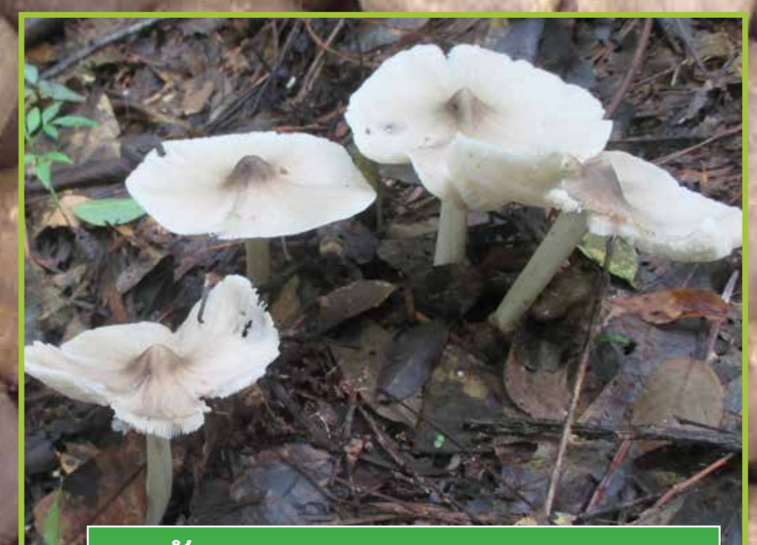
ເຫັດປວກ ( Termitomyces cf. tylerianus )