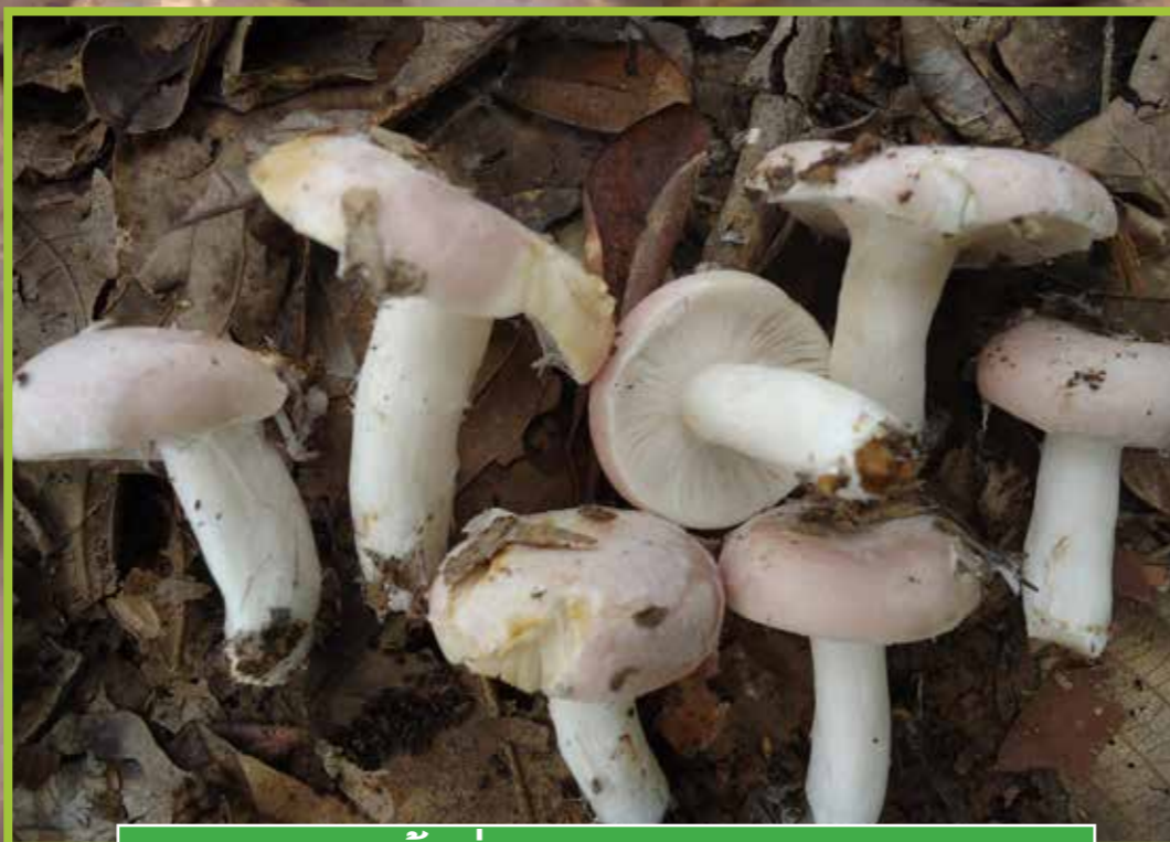
ເຫັດໜ້າອອນ ( Russula cf. vesca )