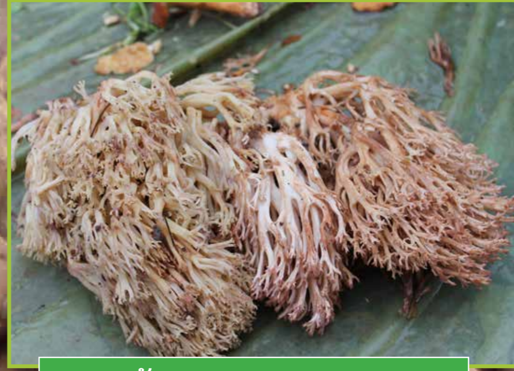
ເຫັດໜວດ ( Ramaria botrytis )