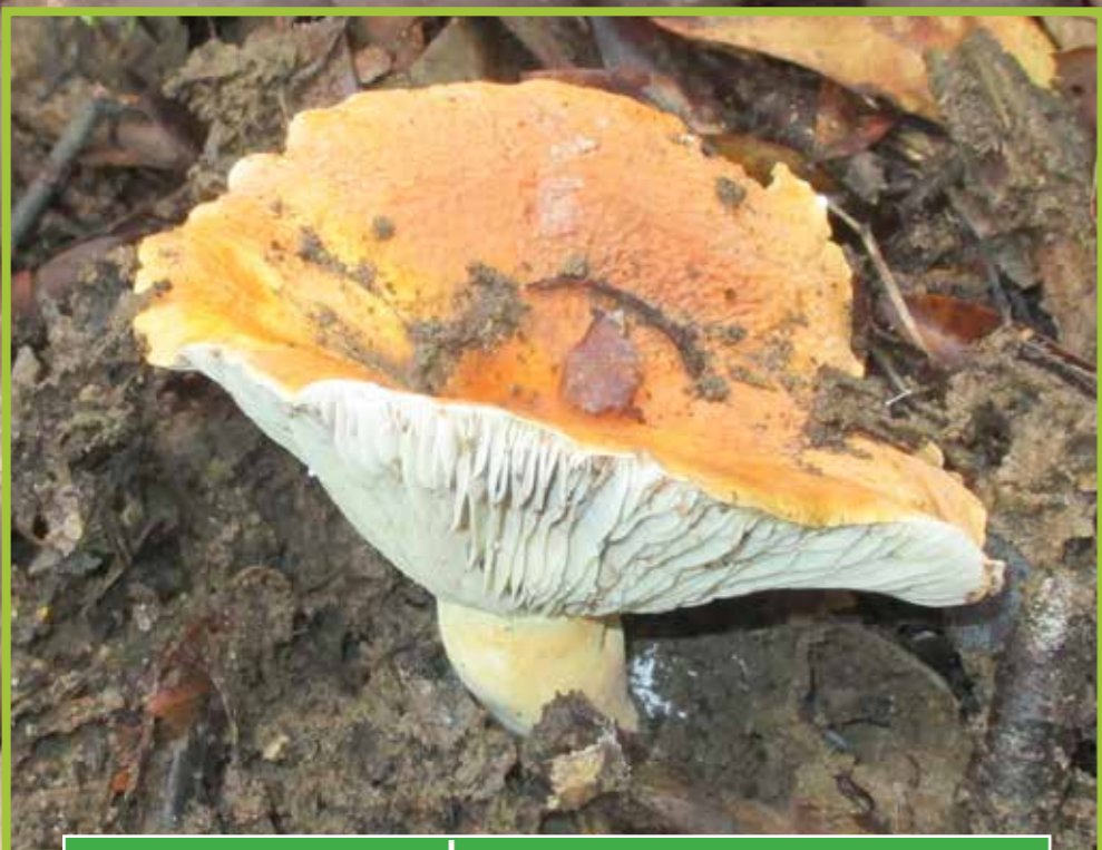
ເຫັດຄຳ ( Lactarius sp. )