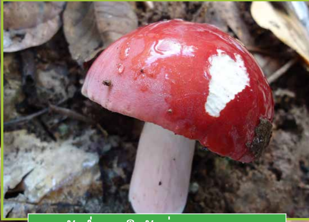
ເຫັດນ້ຳແດງ ຫຼື ເຫັດດູ່ ( Russula rosea )