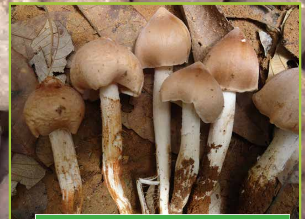
ເຫັດຕາບປວກ ( Termitomyces cf. cartilagineus )