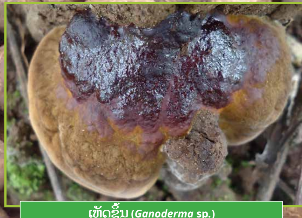
ເຫັດຊິ້ນ ( Ganoderma sp. )