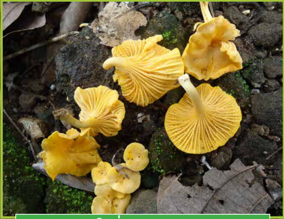
ເຫັດແສດໃຫຍ່ ( Cantharellus cibarius )