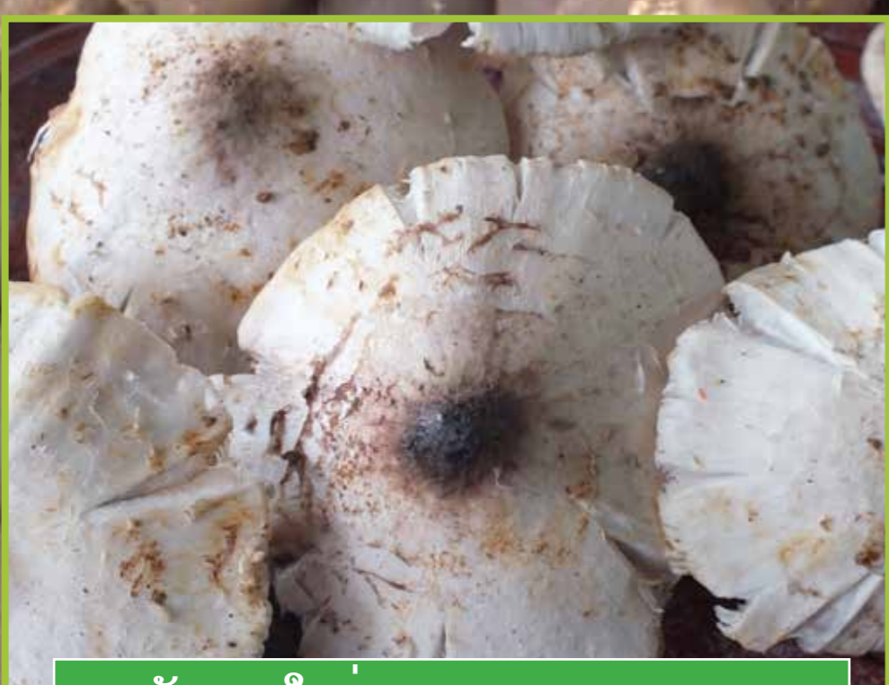
ເຫັດຕາບໃຫຍ່ ( Termitomyces cf. heimii )