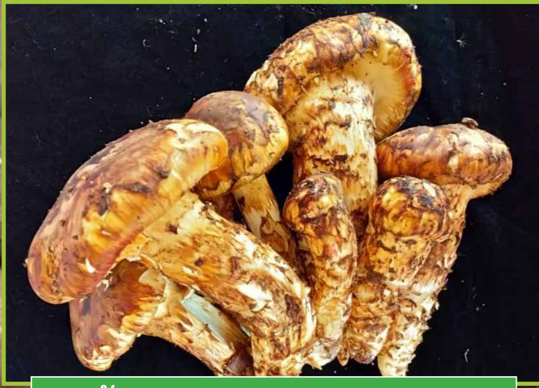
ເຫັດຫວາຍ ( Tricholoma fulvocastaneum )