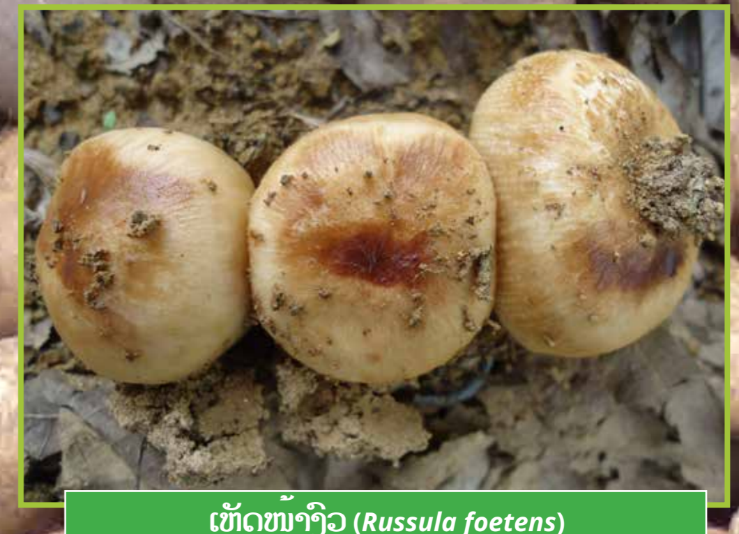
ເຫັດໜ້າງົວ ( Russula foetens )