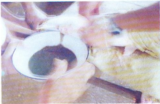
ການຮິດເອົາໄຂ່ປາພອນເພື່ອໄປປະສົມພັນ

ປາພອນຂະໜາດ 1 ກິໂລກະລາມສາມາດໃຫ້ໄຂ່ໄດ້ໂດຍ ສະເລັຍປະມານ 100.000 ໜ່ວຍໄຂ່ປາພອນເປັນໄຂ່ປະເພດເຄິ່ງ ຈົມເຄິ່ງລອຍຂະໜາດຂອງໄຂ່ມີເສັ້ນຜ່າກາງ 2 ມິນລິແມັດ ຊຶ່ງໄຂ່ປາ ຈະແຕກເປັນໂຕໂດຍໃຊ້ເວລາປະມານ 12-17 ຊົ່ວໂມງ ໃນອຸນຫະ ພູມນ້ຳປະມານ 25 - 26 ອົງສາເຊ ປາພອນ ທີ່ທຳການຟັກໄຂ່ໃສ່ ລະບົບນ້ຳໝູນວຽນແມ່ນມີອັດຕາການແຕກອອກສູງ.