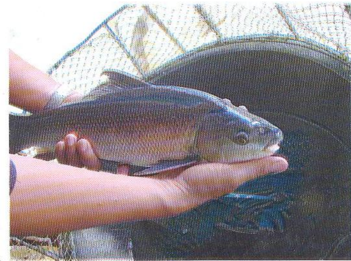
ອາຫານພຽງພໍປາມີອາຍຸໄດ້ 1 ປີຈະມີນ້ຳໜັກເຖິງ 1 ກິໂລກະລາມຂຶ້ນໄປ