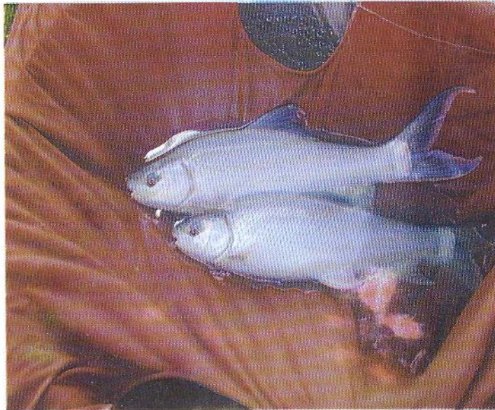
ລູກປາພອນທີ່ມີອາຍຸໄດ້ 6 ເດືອນ

ກະກຽມໜອງໂດຍຫວ່ານປູນຂາວ 200 ກິໂລກະລາມຕໍ່ເຮັກຕາ ແລະ ໃສ່ຝຸ່ນຄອກ (ຂີ້ໄກ່) ປະມານ 500 ກິໂລກະລາມຕໍ່ເຮັກຕາ ການ ອະນຸບານລູກປາພອນໂດຍປ່ອຍລ້ຽງໃນອັດຕາປ່ອຍ 200ໂຕຕໍ່ຕາແມັດ ໃນໄລຍະ 1 ເດືອນ ນຳໃຊ້ອາຫານທີ່ມີໂປຣເຕອິນປະມານ 30%, ພາຍ ທັງຈາກລ້ຽງ 45 ວັນ ແລ້ວ ລູກປາ ຈະມີນ້ຳໜັກ 0,7 ກະລາມ ແລະ ຍາວເຖິງ3,5 ຊັງຕີແມັດ, ຈາກນັ້ນຈຶ່ງລ້ຽງເປັນປາຮາມ ໃຊ້ເວລາ ລ້ຽງ 3 ເດືອນ ປາຈະມີ ນ້ຳໜັກ 15 -20 ກະລາມ ໄລຍະລ້ຽງປີທຳອິດ ປາ ພອນຈະມີການຈະເລີນເຕີບໂຕຊ້າກ່ວາປີຕໍ່ໄປນ້ຳໜັກສະເລັຍມີພຽງ 200 - 300 ກະລາມຖ້າລ້ຽງໃນເງື່ອນໄຂດີມີອາຫານພຽງພໍໄລຍະ 1 ປີ ປາຈະມີນ້ຳໜັກແຕ່ 1 ກິໂລ ຂຶ້ນໄປອີກ. ຢູ່ແຂວງ ຈຳປາສັກປາພອນໄດ້ ນຳມາລ້ຽງ ແບບປະສົມປະສານຂອງຊາວກະສິກອນຮ່ວມກັບສັດ (ໝູ, ໄກ່ ແລະ ເປັດ ) ແມ່ນມີການຈະເລີນເຕີບໂຕໄດ້ດີ ( ອາຍຸ 1 ປີ ໄດ້ 500 - 600 ກຣາມ ).