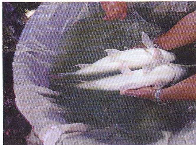
ລັກສະນະເພດຜູ້ ແລະ ເພດແມ່ຂອງປາພອນ

ເປັນປາທີ່ມີ ລັກສະນະຄ້າຍ ຄື ປາສ້ອຍແຕ່ມີຂະໜາດໃຫຍ່ ກວ່າ, ມີລຳໂຕຍາວກົມ, ຫົວຄ່ອນຂ້າງກ້ວາງ ແລະ ສັ້ນ, ບໍ່ມີໜວດ, ເກັດ ມີສີຂາວ ປົນສີທອງ, ສີນ້ຳເງິນ ແລະ ອົມຂຽວເລັກ ນ້ອຍ, ຄືປາພອນມີ ສີຂົມພູ ອອກແດງ, ປາຊະນິດນີ້ ມັກກິນຈຳພວກໂຮນນ້ຳສັດ, ພືດໃນນ້ຳ, ເທົາ, ໂຄນນ້ຳເປັນຫຼັກ. ນອກຈາກນັ້ນຍັງກິນຈຳພວກແມງໄມ້ຊະນິດ ຕ່າງໆ, ປາພອນບໍ່ມີຄວາມທົນທານຕໍ່ອາກາດໜາວເຢັນ.