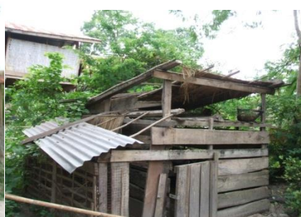
ຄອກບໍ່ເໝາະສົມ