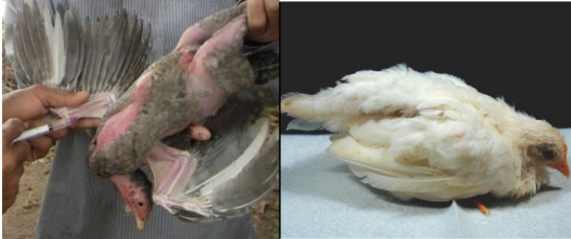
ບໍ່ຕິດຕາມສຸຂະພາບສັດ