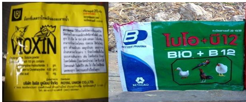
ປະເພດຢາຕ້ານເຊື້ອ

ການນຳໃຊ້ຢາຕ້ານເຊື້ອປະສົມໃສ່ນ້ຳໃຫ້ໄກ່ກິນຕ້ອງປະຕິບັດຕາມຂໍ້ແນະນຳທີ່ຂຽນໄວ້ຂ້າງຊຸງຢາ ຊຶ່ງແຕ່ລະ ຊະນິດຢາ ແຕ່ລະບໍລິສັດທີ່ຜະລິດຈະໄດ້ຂຽນກຳນົດໄວ້ຢ່າງຊັດເຈນ