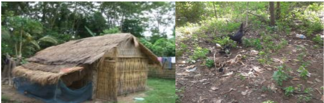
ລັກສະນະຂອງຜື່ນທີ່ກວ້າງຂວາງ-ຮົ່ມເງົາ

ຖ້າຈະລ້ຽງໄກ່ເປັນຈຳນວນຫຼາຍ ຫຼື ລ້ຽງແບບເປັນຝາມ ຄວນຈະຢູ່ ຫ່າງໄກຈາກຊຸມຊົນ (ປ້ອງກັນການລະບາດຂອງເຊື້ອພະຍາດ), ຈະຕ້ອງມີນ້ຳທີ່ສະອາດເພື່ອໃຫ້ໄກ່ໄດ້ກິນ ແລະ ລ້າງອຸປະກອນຮັບໃຊ້ໃຫ້ສະອາດ, ມີລະບົບໄຟຟ້າ ແລະ ຫົນທາງເຂົ້າອອກທີ່ສະດວກ.