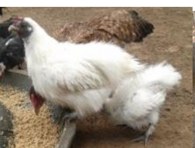
ໄກ່ດູກດຳ