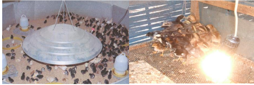
ລັກສະນະຂອງການໃຫ້ຄວາມອົບອຸ່ນໄກ່ນ້ອຍທົດແທນແມ່ໄກ່