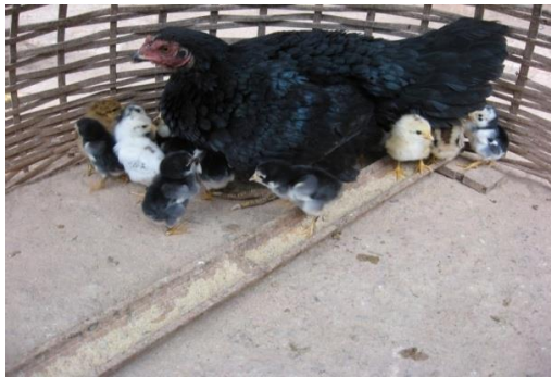
ຂັງແມ່ໄກ່ໄວ້ນ້ຳລູກ