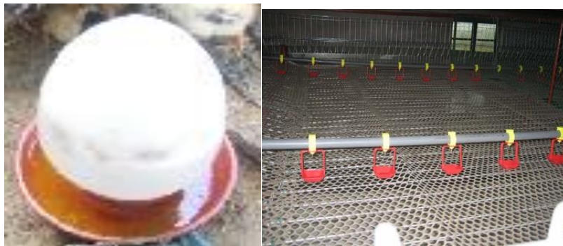
ປ່ອນໃສ່ນໍ້າແບບຕຸກ20-25ໂຕ/ຕຸກປ່ອນໃສ່ນໍ້າແບບມີເຄື່ອຍຕອດກິນ 8ໂຕ/ຈຸດ