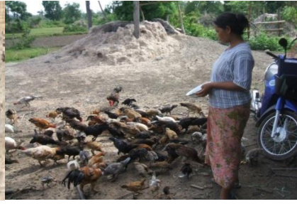
ໃຫ້ອາຫານເປັນປົກກະຕິ