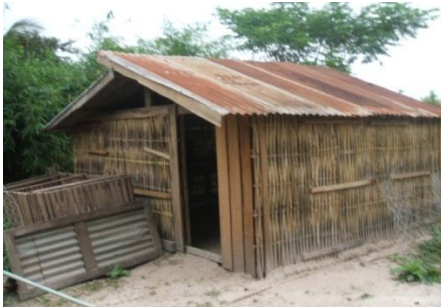
ຄອກທີ່ດີ