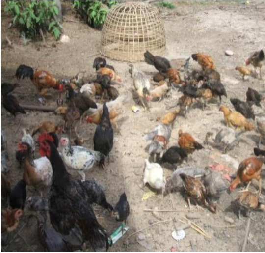
ສະພາບການລ້ຽງໄກ່ລຸ້ນແບບຂັງ ແລະ ແບບປ່ອຍ