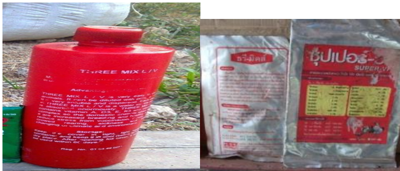
ປະເພດວິດຕາມິນ

ບໍ່ຄວນໃຫ້ຄົນນອກ ຫຼື ສັດຊະນິດອື່ນເຂົ້າໄປໃນບໍລິເວນລ້ຽງສັດ ເພາະອາດເປັນການນຳເຊື້ອພະຍາດເຂົ້າໄປ ຕິດຕໍ່ໃສ່ຝູງສັດ