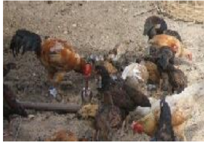
ໃຫ້ໄກ່ຊອກຫາກິນເອງເປັນຫຼັກ