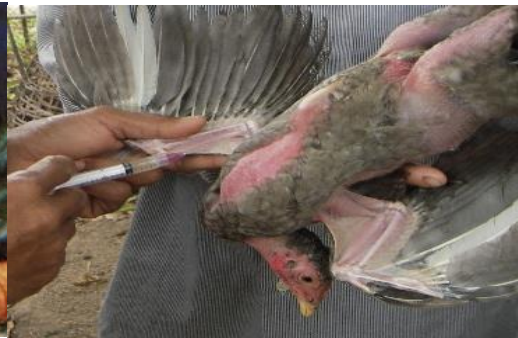
ການສັກໝາກສຸກສັດປີກການສັກອະຫິວາສັດປີກ