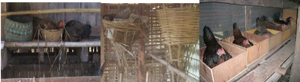
ລັກສະນະທົ່ວໄປຂອງຮັງໄຂ່

ຖ້າຕ້ອງການໃຫ້ແມ່ໄກ່ໃຫ້ໄຂ່ຫຼາຍເທື່ອຕໍ່ປີ ໃຫ້ປະຕິບັດດັ່ງນີ້: