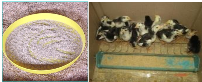
ບ່ອນໃສ່ອາຫານແບບຖາດບ່ອນໃສ່ອາຫານແບບຮາງຍາວ