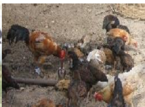
ບໍ່ຄັດຝ່ຳແມ່ຝັນ