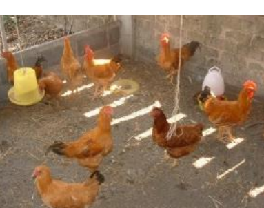
ໄກ່ຕຳຮວງ