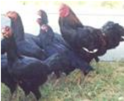
ຄັດແນວຝັນທີ່ດີ