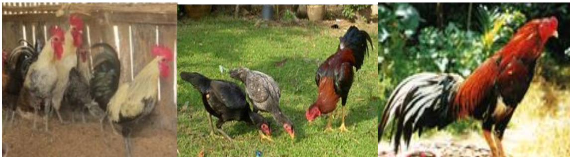
ລ້ຽງເພື່ອຜະລິດລູກ