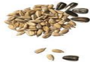
ແກ່ນຖົ່ວ