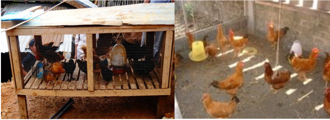
ຮູບແບບຂອງການລ້ຽງຂັງໃນກິງ ແລະ ໃນຄອກຕະລອດ

ດັ່ງນັ້ນການລ້ຽງໄກ່ລາດທີ່ດີຄວນມີຜື່ນທີ່ກວ້າງຂວາງພໍສົມຄວນ ແລະ ເປັນຜື່ນທີ່ດັ່ງນີ້: