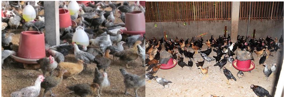
ລັກສະນະການລ້ຽງແບບຂັງ