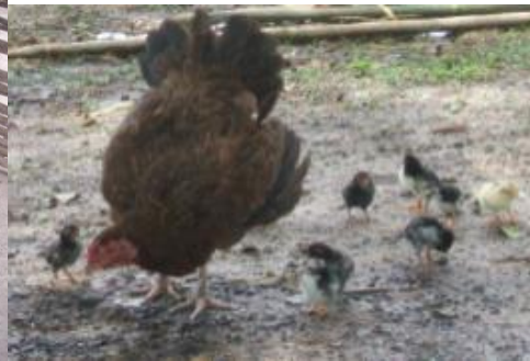
ປ່ອຍໄກ່ນ້ອຍອອກໄປຫາກິນແມ່ໄກ່

ຖ້າແຍກໄກ່ນ້ອຍອອກຈາກແມ່ໄກ່ມາລ້ຽງຕ່າງຫາກ ຈະຊ່ວຍໃຫ້ແມ່ໄກ່ໃຫ້ໄຂ່ໄດ້ 3-4 ຄັ້ງ/ປີ ຫຼື ໃຫ້ລູກປະມານ 30 ໂຕ/ແມ່/ປີ ການແຍກໄກ່ນ້ອຍຫຼັງຝັກແຕກອອກມາລ້ຽງຕ່າງຫາກ ຕ້ອງໄດ້ເອົາໃຈໃສ່ໃນເລື່ອງການໃຫ້ນ້ຳ ແລະ ການໃຫ້ອາຫານທີ່ມີຄຸນນະພາບໃຫ້ໄກ່ໄດ້ກິນຕະຫຼອດຈະຊ່ວຍໃຫ້ໄກ່ໃຫຍ່ໄວ