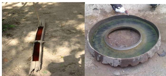
ປ່ອນໃສ່ນໍ້າແບບຕັດແປງ 10-15ຊັງຕີແມັດ/ໂຕ