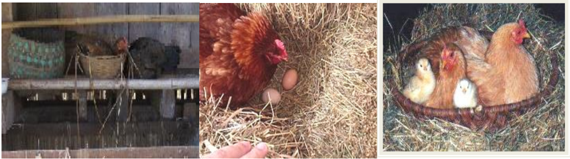
ການໄຂ່ ແລະ ການຝັກໄຂ່ຂອງແມ່ໄກ່

ຊ່ວງລະດູຜົນບໍ່ແນະນຳໃຫ້ລ້ຽງໄກ່ນ້ອຍ ເພາະໂອກາດໄກ່ນ້ອຍຈະລອດຕາຍມີບໍ່ຫຼາຍ ເຖິງລອດຕາຍມາກໍ່ມີລັກສະນະນ້ອຍຄອດນານໃຫຍ່.