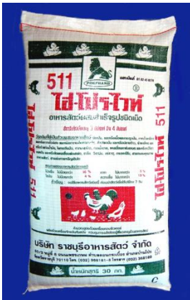
ອາຫານສຳເລັດຮູບ

ຄວນມີແຫຼ່ງທາດຊີ້ນເຊັ່ນ ອາຫານສຳເລັດຮູບ, ໃບຜິດແຫ້ງບົດ, ກາກນ້ຳເຕົ້າຮູ້ , ພວກສັດນ້ອຍປະເພດຕ່າງໆ, ແກ່ນຜິດ ແລະ ອື່ນໆ ປະມານ 10% ຂອງນ້ຳໜັກອາຫານທັງໝົດ.