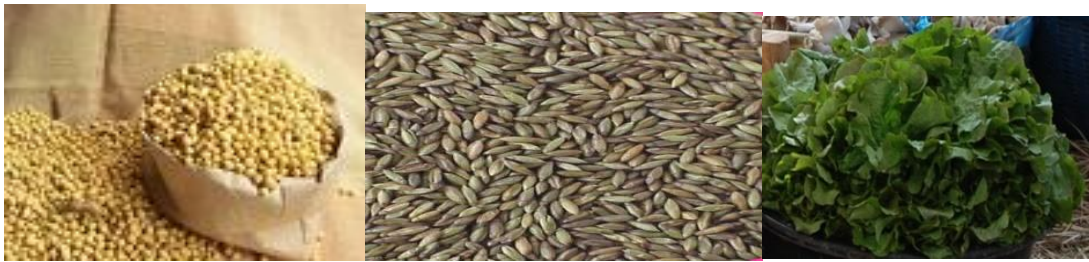
ແກ່ນຖົ່ວ