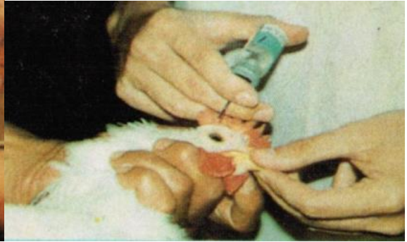
ການຢອດວັກຊີນ ນິວຄາເຊັນ