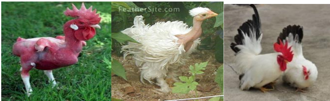
ລ້ຽງເພື່ອສວຍງາມ

ການຄັດເລືອກເອົາໄກ່ລັກສະນະແບບໃດ ຫຼື ໄກ່ສາຍຜັນໃດເຂົ້າມາລ້ຽງ ແມ່ນຂຶ້ນກັບຈຸດປະສົງຫຼືເປົ້າໝາຍຂອງຜູ້ລ້ຽງເປັນຫຼັກ ວ່າຈະລ້ຽງເພື່ອຄວາມສວຍງາມ, ລ້ຽງເພື່ອຜະລິດລູກໄກ່ຂາຍ, ລ້ຽງເພື່ອການກິລາ ຫຼື ຈະລ້ຽງໄວ້ເປັນແຫຼ່ງອາຫານປະເພດທາດຊື່ນ