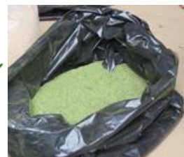
ໃບຜິດແຫ້ງບົດ

ຖ້າລ້ຽງໄກໃນປະລິມານໜ້ອຍໂຕ ຈະໃຊ້ຮຳປະສົມສາລີບົດ ແລະ ໃບກະຖິນແຫ້ງບົດ (ໃບມັນຕົ້ນແຫ້ງບົດ) ກໍ ບໍ່ໃຊ້ໄດ້, ສ່ວນແຮ່ທາດນ້ຳໃຊ້ເປືອກຫອຍ ຫຼື ເປືອກໄຂ່ບົດກໍ່ພຽງພໍ. ຖ້າມີໄກຫຼາຍຕ້ອງໃຫ້ອາຫານຫຼາຍຈຸດ ໃຫ້ໄກໄດ້ ກິນອາຫານພ້ອມກັນ