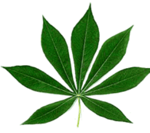
ໃບມັນຕົ້ນ