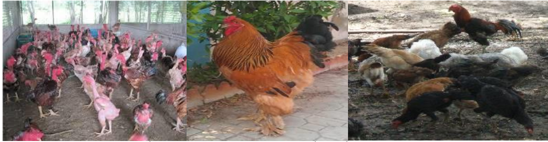
ໄກ່ສາຍຜັນອື່ນໆ