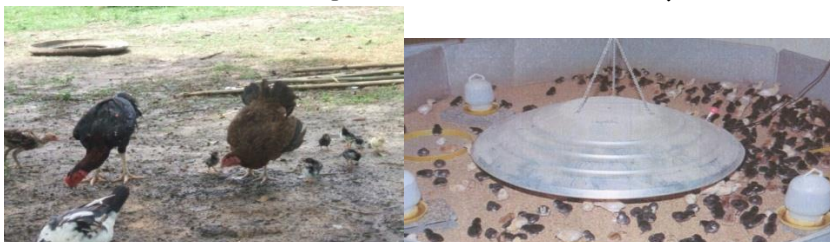
ລ້ຽງປະລິມານໜ້ອຍ