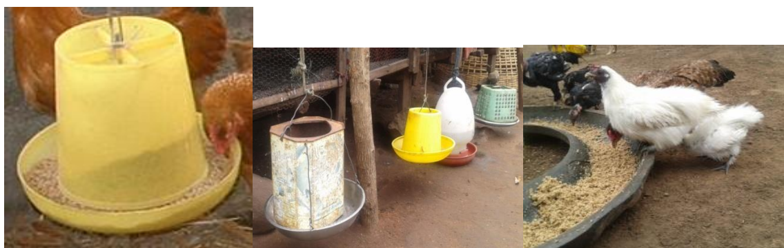
ບ່ອນໃສ່ອາຫານແບບຖັງແຂວນບ່ອນໃສ່ອາຫານແບບດັດແປງ