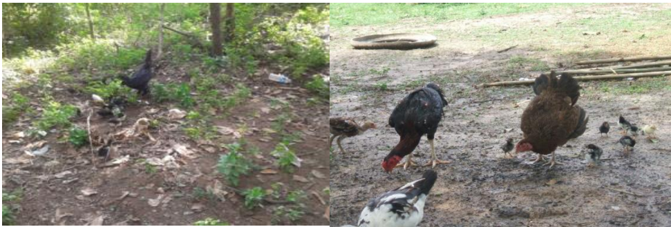
ລັກສະນະການລ້ຽງແບບປ່ອຍ

ຮູບແບບຂອງການລ້ຽງໄກ່ລາດບໍ່ວ່າຈະເປັນການລ້ຽງແບບຂັງ ຫຼື ລ້ຽງແບບປ່ອຍຕາມເດີນບ້ານ ຕ່າງກໍມີຈຸດດີ ແລະ ຈຸດອ່ອນທີ່ແຕກຕ່າງກັນ ດັ່ງນັ້ນການທີ່ຜູ້ລ້ຽງຈະເລືອກລ້ຽງໃນຮູບແບບໃດ ແມ່ນອີງໃສ່ຄວາມສະດວກ, ອີງໃສ່ຈຳນວນໄກ່ ແລະ ຂຶ້ນກັບພື້ນທີ່ທີ່ຈະນຳໃຊ້ເຂົ້າໃນການລ້ຽງໄກ່ ຊຶ່ງໂດຍທົ່ວໄປແລ້ວການລ້ຽງໄກ່ລາດມັກຈະນິຍົມລ້ຽງ 3 ຮູບແບບຄື