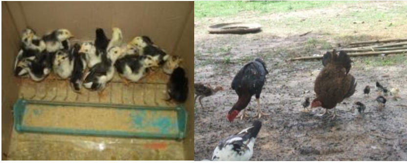
ເອົາໃຈໃສ່ຮັກສາສຸຂະພາບສັດ