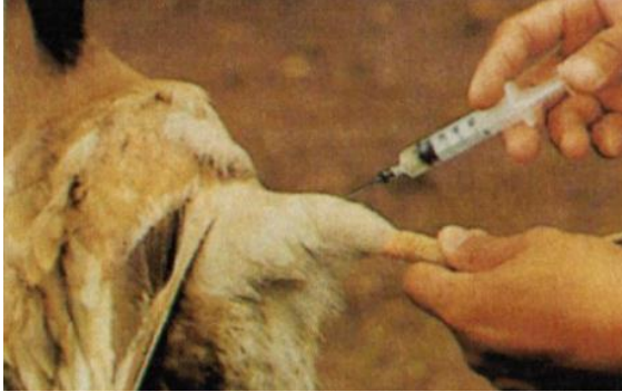
ການສັກວັກຊີນ ນິວຄາເຊັນ

-ອຸປະກອນທີ່ນຳໃຊ້ເຂົ້າໃນການສັກວັກຊີນ ຊະນິດທີ່ນຳໃຊ້ໄດ້ຫຼາຍເທື່ອເຊັ່ນ: ສະແຫຼັງແລະ ເຂັ້ມບາງຊະນິດ ແມ່ນໃຫ້ນຳໄປຕົ້ມ ຕາກແດດໃຫ້ແຫ້ງກ່ອນເກັບຮັກສາໄວ້ໃຊ້ຄັ້ງຕໍ່ໄປ. ແຕ່ບາງຊະນິດຫຼັງການນຳໃຊ້ຕ້ອງເກັບມ້ຽນໃຫ້ ປອດໄພກ່ອນນຳໄປທຳລາຍ ຫຼື ເຜົາເຊັ່ນ: ກວດແກ້ວຂອງວັກຊີນ, ເຂັ້ມ, ສະແຫຼັງ ແລະ ອື່ນໆ.