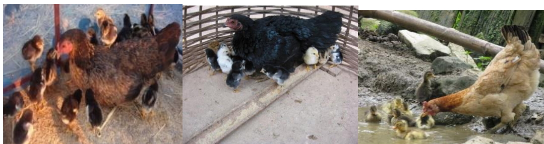
ລັກສະນະຂອງໄກ່ແມ່ທີ່ດີ