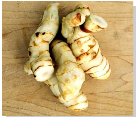
ຂ່າອ່ອນ ໃຊ້ສຳລັບປຸງແຕ່ງອາຫານ

ໃນໄລຍະທຳອິດຫຼັງຈາກປູກ ແມ່ນໃຫ້ເສຍຫຍ້າ 3 ເທື່ອ / ປີ