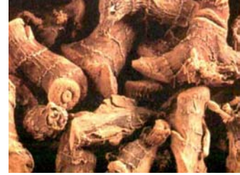
ຂ່າແກ່ ໃຊ້ສຳລັບປຸງແຕ່ງຢາ

ຂ່າອ່ອນ ( ປຸງແຕ່ງອາຫານ ) ແມ່ນສາມາດເກັບໄດ້ຫຼັງປູກປະມານ: 6 ຫາ 8 ເດືອນ ແລະ ສາມາດເກັບໄດ້ຍາວນານຮອດ 10 ປີ, ຂ່າອ່ອນທີ່ສາມາດເກັບກ່ຽວໄດ້ນັ້ນ ແມ່ນສັງເກດຕົ້ນທີ່ມີໃບ 2 ຫາ 3 ໃບ