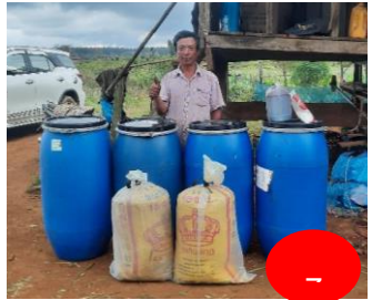
ເກັບມ້ຽນໄວ້ໃນງົວກິນໃນ