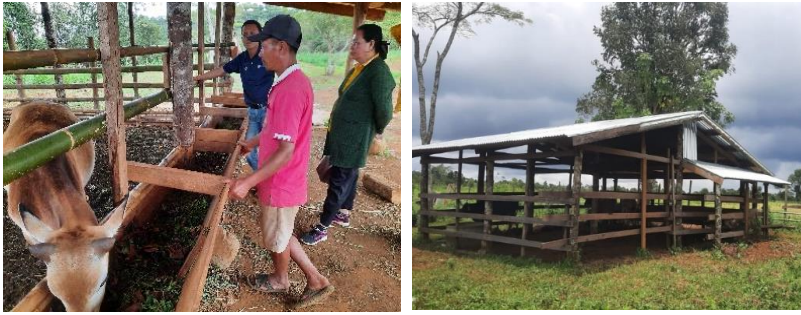
ຮ່າງອາຫານ