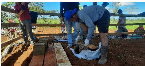
ເອົາກ້ອນແຮ່ທາດທີ່ອັດແໜ້ນໄປຕາກ