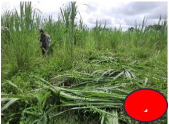
ຕັດ ແລະ ຂົນອອກຈາກສວນມາໃສລົດ