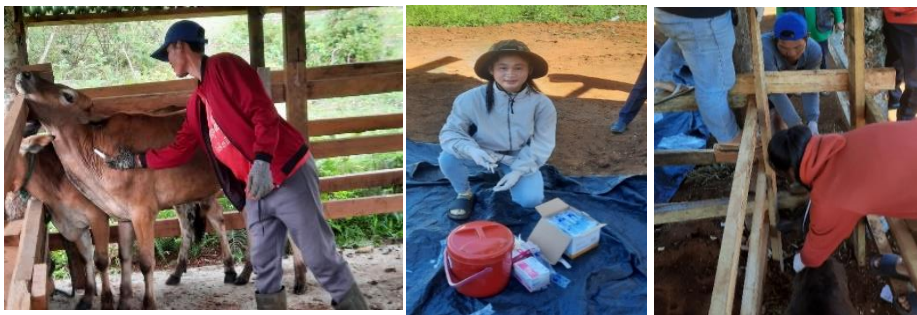
ການສັກຢາປ້ອງກັນກັນ

ສິ່ງທີ່ຄວນເອົາໃຈໃສ່ ໃນລະບົບການລ້ຽງງົວ ແບບໃໝ່ ຊາວກະສິກອນຜູ້ລ້ຽງສັດ ຕ້ອງເອົາໃຈໃສ່ຮັກສາສຸຂະພາບງົວ ດ້ວຍ ການສັກຢາປ້ອງກັນ.