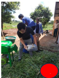
ໃສ່ກາກນ້ຳຕານ