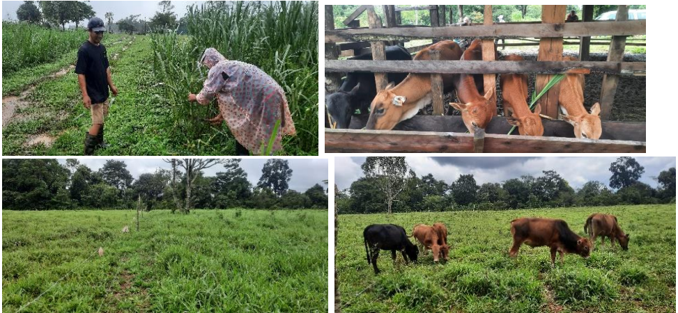
ການຕັດຫຍ້າໃຫ້ງົວກິນ

ລະບົບການຕັດໃຫ້ງົວກິນ. ຂອງຄອບຄົວທ່ານກົງຕາ ແລະ ທ່ານ ໄຜຄຳ