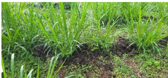
ການໃສ່ຝຸ່ນຄອກພາຍລັງການຕັດຫຍ້າ ທຸກໆຄັ້ງ.