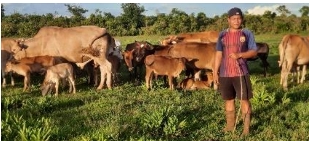
ຮູບແບບເກົ່າລ້ຽງປ່ອຍ.