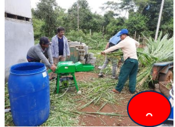
ຕັດຫຍ້າເນເບ້ຍເປັນຕ່ອນ ນ້ອຍໆ 2-3 ຂຕມ.