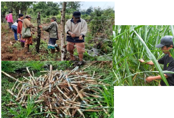
ການປູກຫຍ້າ ເນເປັຍ ປາກຊ່ອງ 1. ຂອງ ທ່ານ ໂພຄຳ ຢູ່ບ້ານບັງລຽງ.