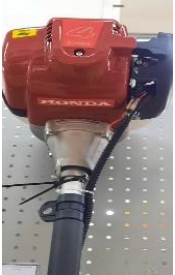
ຈັກຕັດຫຍ້າ.