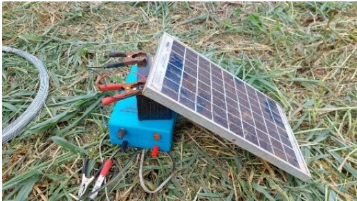
ເຮົາແບ່ງສວນຫຍ້າອອກເປັນ 4 ລ່ອກຍ່ອຍ ດ້ວຍຮີ້ວໄຟຟ້າ.

ລະບົບການຕັດໃຫ້ງົວກິນ. ຂອງຄອບຄົວທ່ານກົງຕາ ແລະ ທ່ານ ໄຜຄຳ