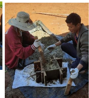
ຕຳໃຫ້ແໜ້ນ