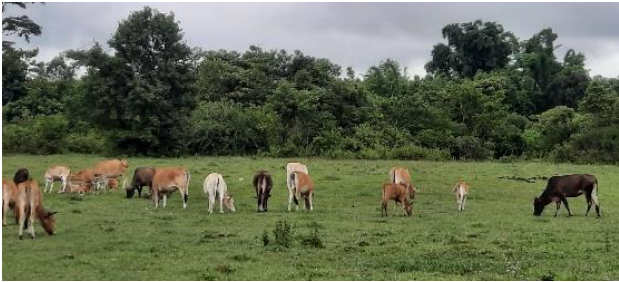
ແບບເກົ່າ