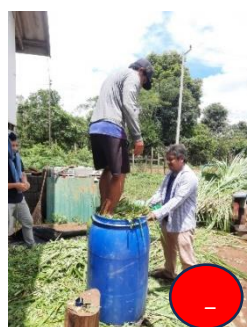
ຢຽບໃຫ້ແໜ້ນໄລ່ອາກາດອອກ ແລະອັດໃຫ້ແໜ້ນ