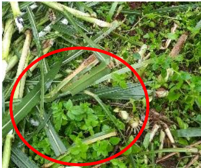
ສໍາລັບຫຍ້າເນເບັ້ຍໃຫ້ຕັດຈໍາດິນ.