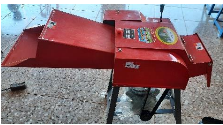
ຈັກບີດຫຍ້າ