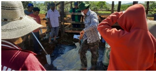
ເອົາສ່ວນປະສົມເທລົງ

ກ້ອນແຮ່ທາດອາຫານເສີມ ແມ່ນ ການລວບລວມເອົາສ່ວນປະກອບຕ່າງ ທີ່ມີຄຸນຄ່າທາງດ້ານອາຫານ ສຳລັບສັດລ້ຽງ ຊຶ່ງຊອກຫາໄດ້ງ່າຍໃນທ້ອງຖິ່ນເພື່ອນຳມາປະກອບເຮັດເປັນກ້ອນ ແລ້ວນຳໄປໃຫ້ສັດກິນ. ກ້ອນແຮ່ທາດອາຫານເສີມ ສາມາດຕອບສະໜອງທາງດ້ານຜະລັງງານ. ທາດຊື່ນ ແລະ ແຮ່ທາດໃຫ້ແກ່ສັດ.