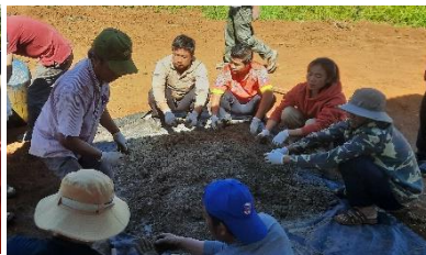
ປະສົມໃຫ້ເຂົ້າກັນດີ