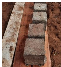
ຕາກຜິ່ງລົມໃນຮົມ.