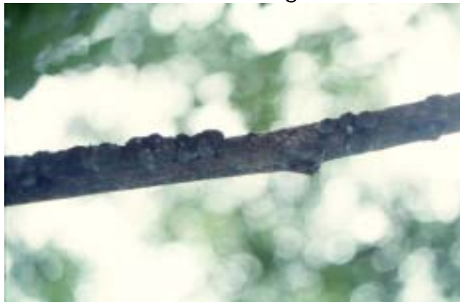
ຮູບທີ່ 2 ຄັ່ງທີ່ຈັບຢູ່ນ້ຳກິ່ງໄມ້

ຖ້າປະຊາຊົນຄອບຄົວໃດໜຶ່ງສິນໃຈຈະລ້ຽງຄັ່ງໄວ້ຕາມຕົ້ນໄມ້ບໍລິເວນບ້ານຫຼືຕາມຫົວໄຮ່ ປາຍນາ, ໃນແຕ່ລະປີກໍ່ຈະສາມາດຂາຍໄດ້ເງິນເປັນການເພີ່ມພູນລາຍໄດ້ພາຍໃນຄອບຄົວຢ່າງຫຼວງຫຼາຍ. ສະນັ້ນ, ສາມາດເວົ້າໄດ້ວ່າເຮົາສາມາດເຮັດເປັນອາຊີບຫຼືວຽກເສີມກໍ່ໄດ້.