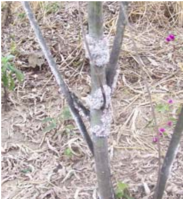
ຮູບທີ 5. ຄັງກຳລັງຂະຫຍາຍຕົວຢູ່ຕາມຕົ້ນໄມ້

ກິ່ງໄມ້ທີ່ຄັງຈັບເຮັດຮ່າງາມດີທີ່ຕັດໄວ້ເປັນພັນນັ້ນມາ ຕັດເປັນທ່ອນ ແຕ່ລະທ່ອນຍາວ 1ນິ້ວມື, ພໍຄັງໂຕອ່ອນ ອອກກໍນຳໄປປ່ອຍໂດຍການມັດຕິດ ຫຼືແຂວນ ໄວ້ຕາມ ກິ່ງໄມ້ ຂອງຕົ້ນໄມ້ທີ່ຕ້ອງການຈະລ້ຽງຄັງໃສ່ນັ້ນ. ກິ່ງທີ່ຈະ ແຂວນແນວພັນຄັງໃສ່ຕ້ອງເປັນກິ່ງທີ່ ອວບອ່ອນ ພໍປານ ກາງ, ກິ່ງອ່ອນຫຼືແກ່ເກີນໄປແມ່ນຄັງຈະ ຈັບເຮັດ ຮ່າງບໍ່ໄດ້.