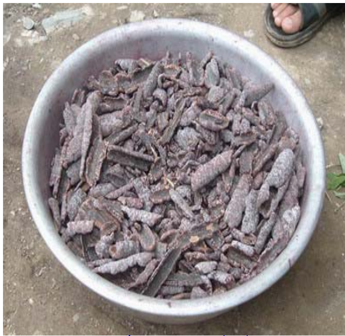
ຮູບທີ6 . ຜົນຜະລິດຄັງ(ຄັງສົດ)

ວິທີການເກັບຄັງ: ໃນແຕ່ລະປີຈະສາມາດເກັບຄັງໄດ້ 2 ເທື່ອ ຄື: ໃນຊ່ວງເດືອນ ເມສາ(4) ຫາ ເດືອນ ພຶດສະພາ(5) ແລະ ເດືອນຕຸລາ(10) ຫາເດືອນພະຈິກ (11). ການເກັບແມ່ນຂຶ້ນ ໄປຮານກິ່ງໄມ້ທີ່ຄັງຕິດນັ້ນລົງ; ກິ່ງໃດທີ່ຄັງຈັບງາມດີກໍຄັດ ເລືອກອອກໄວ້ເປັນແນວພັນຕໍ່ໄປ, ສ່ວນທີ່ເຫຼືອກໍເສາຍເອົາ ຄັງອອກຈາກກິ່ງໄມ້ ແລ້ວນຳເອົາຄັງໄປຕາກໄວ້ໃນລານ ບ່ອນຮົ່ມແລະມີລົມພັດດີຈະໄດ້ຄັງປຽກ, ຖ້າຈະເຮັດເປັນ ຄັງແຫ້ງຕ້ອງຕາກແດດໃຫ້ໄດ້ປະມານ 2 ຫາ 3 ມື້ຈິ່ງສາ ມາດນຳໄປຊີ້ຂາຍໄດ້ໃນທ້ອງຕະຫຼາດ .