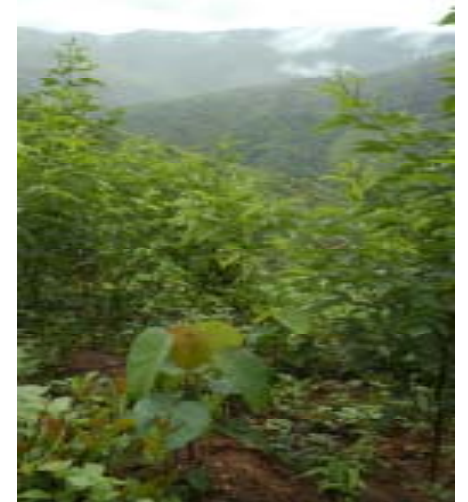
ຮູບທີ່ 4 . ຕົ້ນໄມ້ທີ່ສາມາດປ່ອຍຄັ່ງໄດ້

ພັນໄມ້ທີ່ໃຊ້ລ້ຽງຄັ່ງ: ພັນໄມ້ທີ່ໃຊ້ລ້ຽງຄັ່ງແລະໄດ້ຄັ່ງຄຸນນະພາບດີ ລຽງຕາມລຳດັບຄຸນນະພາບຂອງຄັ່ງທີ່ຈະໄດ້ມີ : ຕົ້ນຖົ່ວແຮ, ໄມ້ລຽງ, ໄມ້ໝາກແຟນ, ຕົ້ນສາມສາ, ແລະຕົ້ນໄມ້ ປ່າຊະນິດອື່ນໆ.