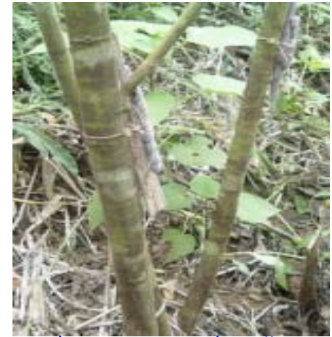
ຮູບທີ່ 3 ວິທີການປ່ອຍຄັ່ງໃສ່ຕົ້ນໄມ້

ເດືອນເມສາ(4) ຫາເດືອນພຶດສະພາ(5) ແລະເກັບຜົນ ໃນເດືອນ ຕຸລາ (10) ຫາເດືອນພະຈິກ(11), (ສຳລັບຢູ່ແຂວງຫຼວງພະບາງ).